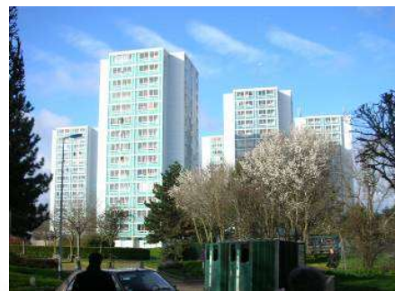
Vues extérieures des bâtiments à démolir