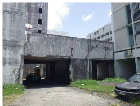
Vues extérieurs des bâtiments à démolir