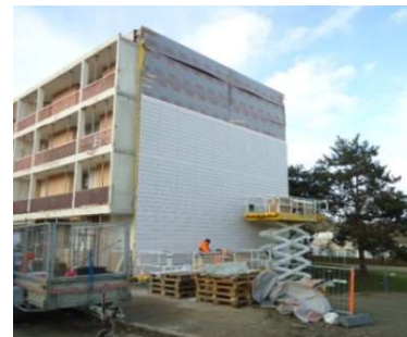
Vues des reprises sur pignons