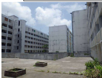
Vues de l'esplanade et des bâtiments à traiter Enduits TECHNICOAT amiantés sur les structures