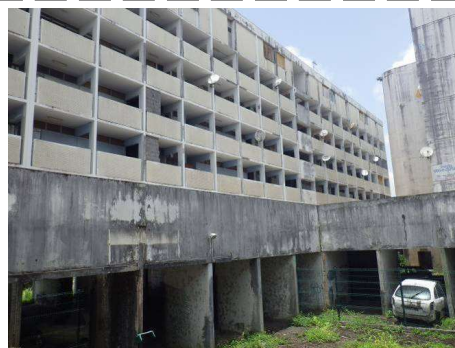
Façades avec colles de faïences amiantées